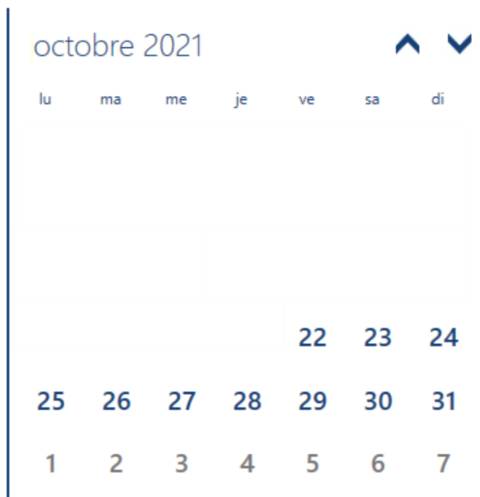
Vue modifiée du calendrier des réceptions